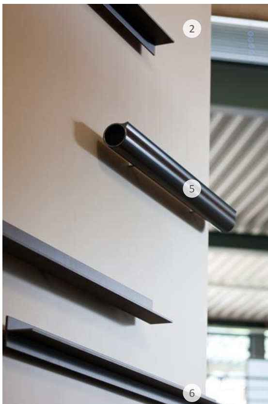
Verschiedene Bronzetöne und Glanzgrade Different bronze colours and gloss grades