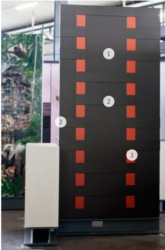
Vorderansicht Front elevation