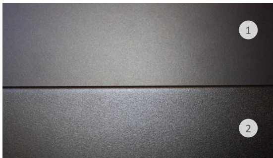
Detail Pulverlackbeschichtung mit und ohne Perlglimmereffekt Detail powder coating with and without pearl mica effect