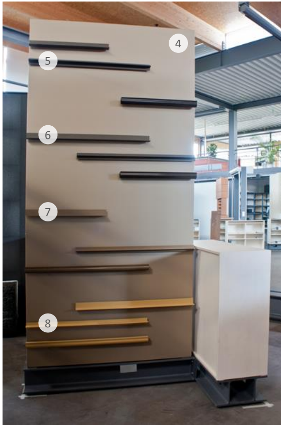
Rückansicht Back elevation