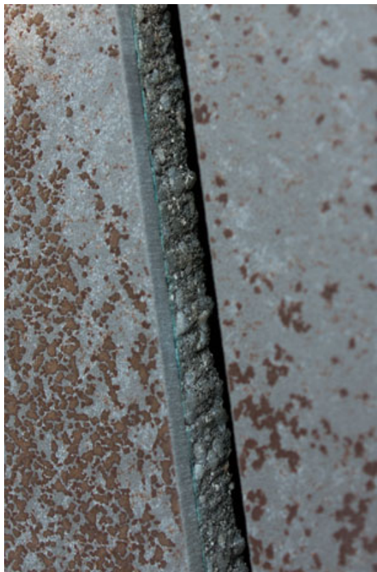
Detailansicht Detail elevation