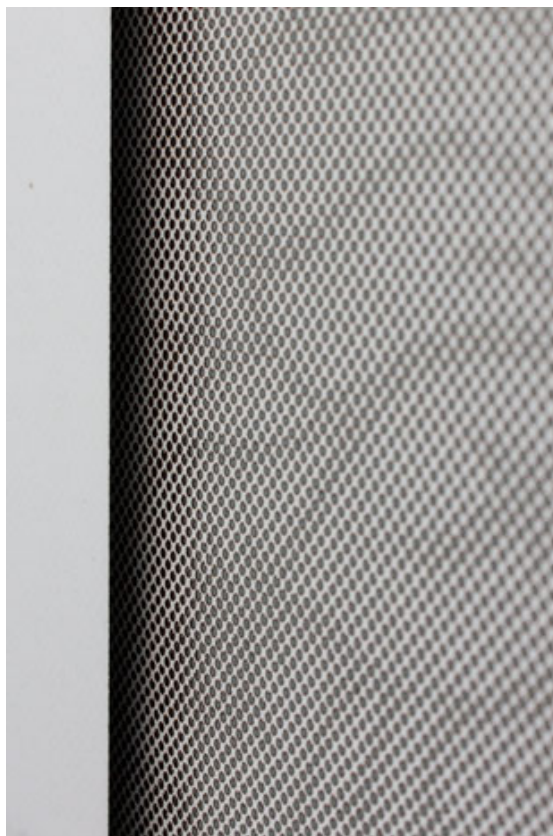
Detailansicht Detail elevation